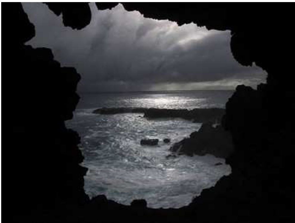
Cueva de las dos ventanas. Fotografía Juan Cesar Astudillo, 2009. Archivo Fotográfico. Museo Histórico Nacional.