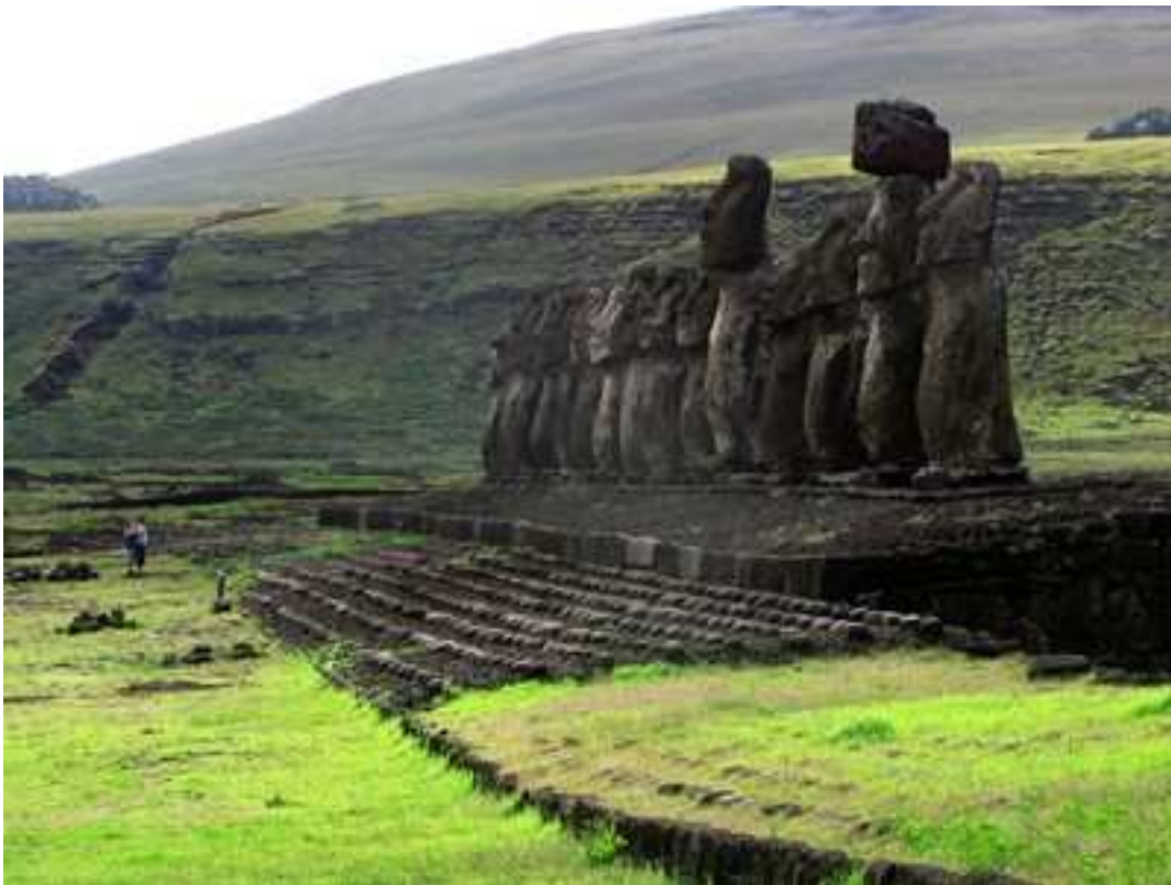
Ahu Tongariki, cuenta con 15 Moais de gran tamaño. Fotografía Juan Cesar Astudillo, 2009. Archivo Fotográfico. Museo Histórico Nacional