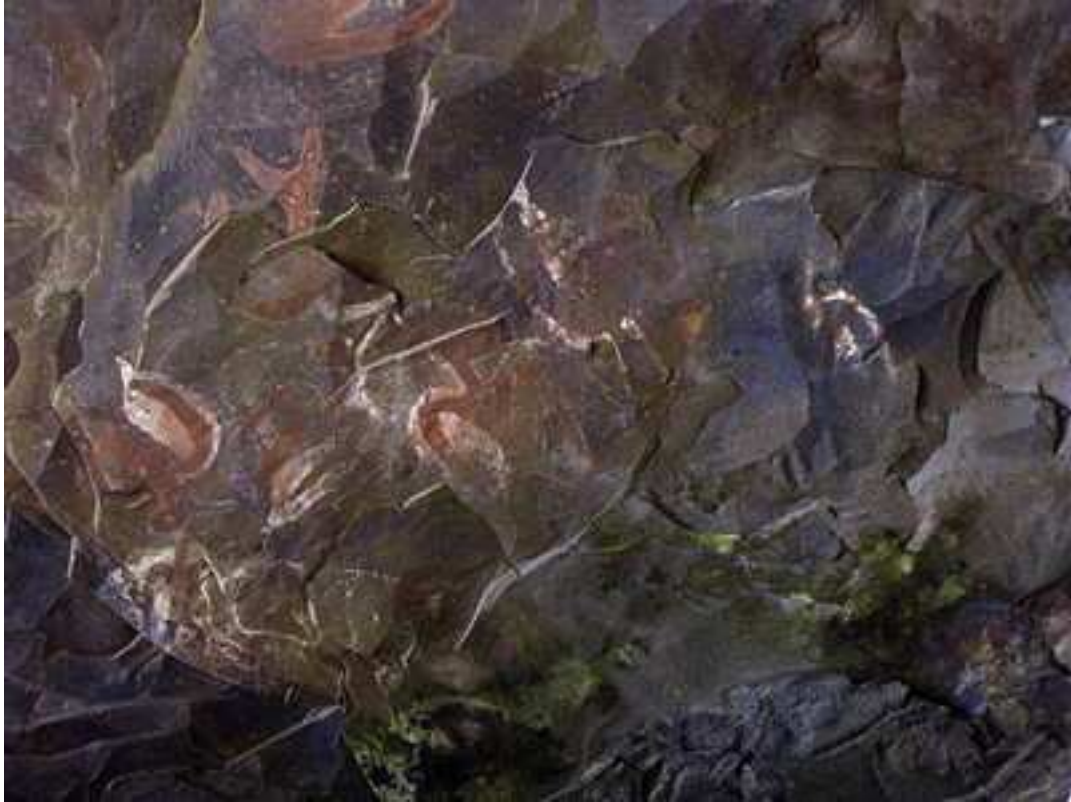
Pintura rupestre en la cueva de Ana Kai Tangata.