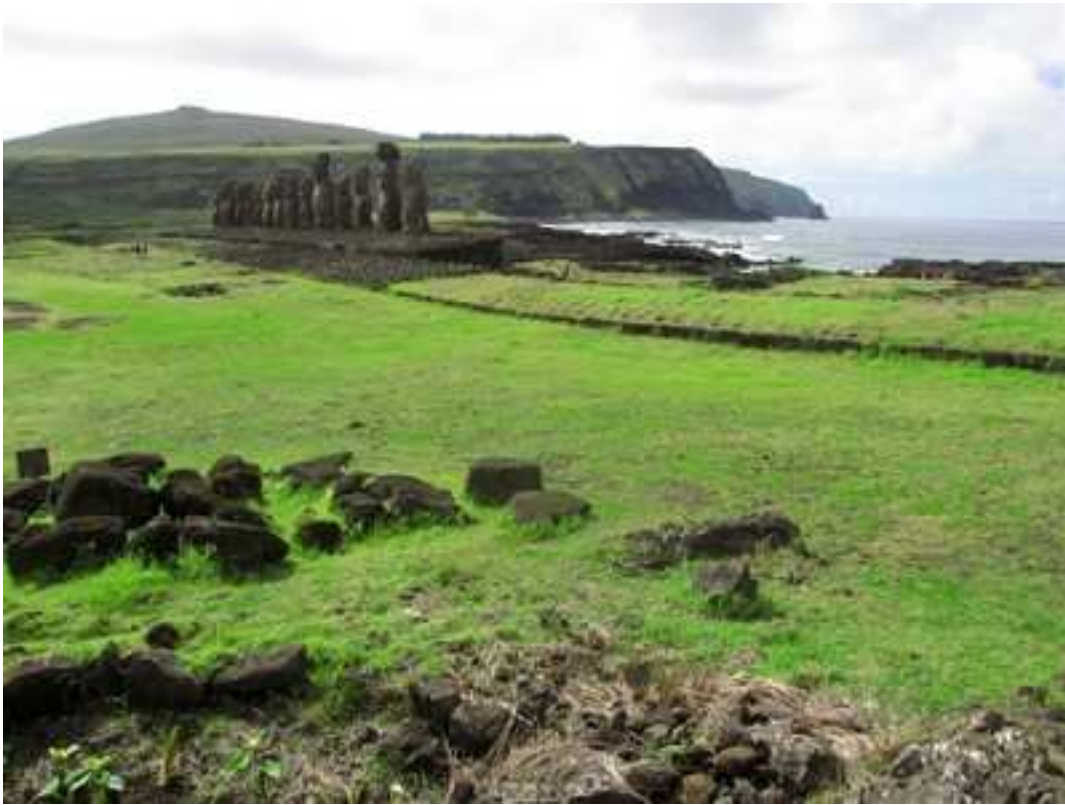
Vista de Ahu Togariki.