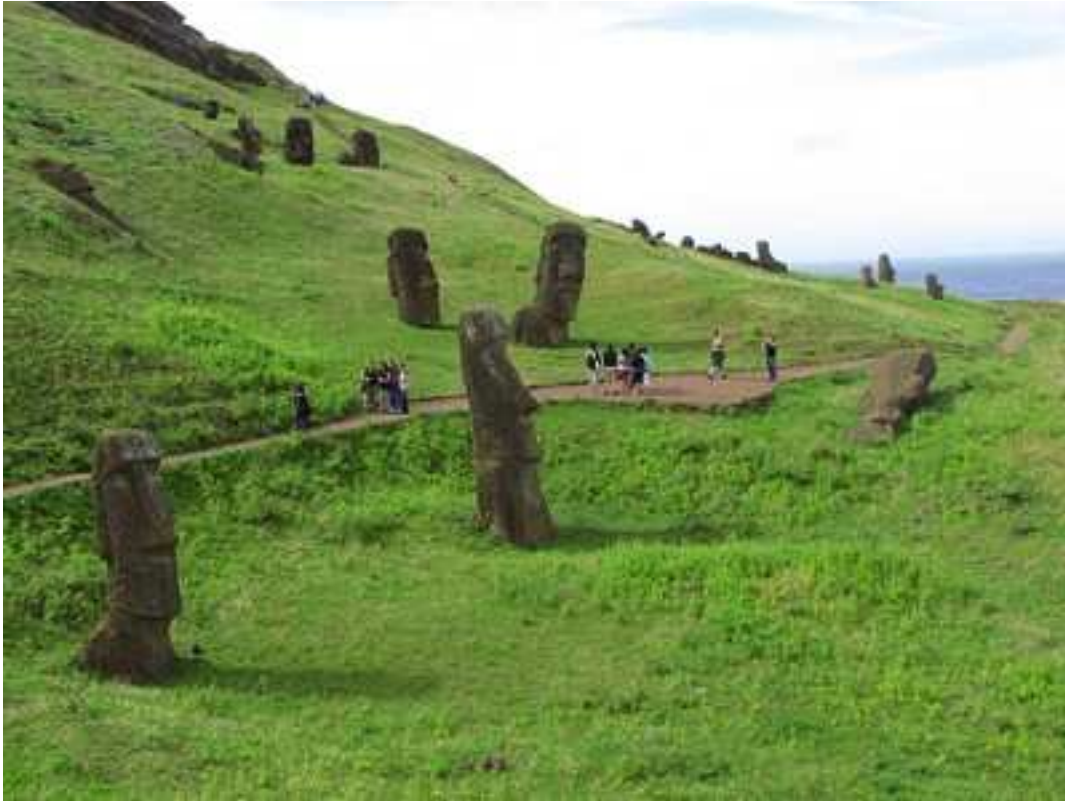
Moais en la ladera del Volcán Rano Raraku.

Rapa Nui, cuyo mayor vestigio de su apogeo cultural y religioso son los enormes y misteriosos Moais.