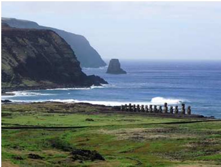
Ahu Togariki, el más grande y colosal de todos, cuenta con 15 Moais de gran Tamaño. Fotografía Juan César Astudillo C. 2009. Archivo Fotográfico. Museo Histórico Nacional.

Departamento Educativo Museo Histórico Nacional