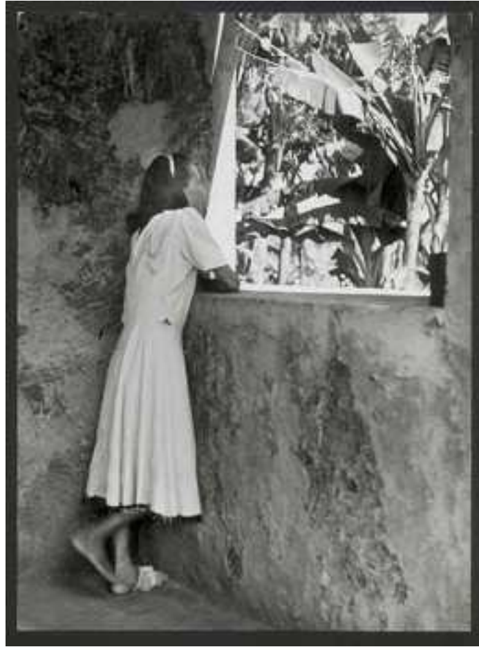
Mujer en leproscario de Isla de Pascua. Fotografía 1950.