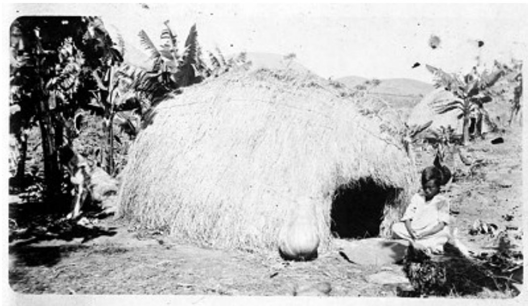
Chozas de fibra vegetal construidas en Isla de Pascua. Fotografía 1925.

Sin duda unos de los mayores misterios de la isla lo componen las enormes estatuas de piedra llamadas Moáis, que constituyen uno de los más valiosos patrimonios de la humanidad, tanto por su enorme valor arquitectónico, como también por su gran misterio acerca de cómo se lograron levantar tan enormes y bellas esculturas.