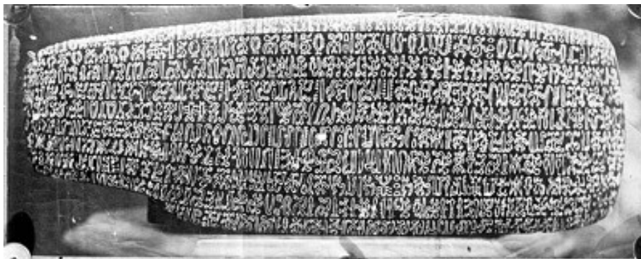
Tableta parlante con jeroglíficos de Isla de Pascua. Fotografía 1935. Archivo Fotográfico. Museo Histórico Nacional.